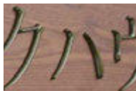
シャインフォレスト